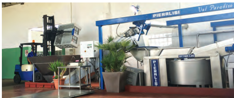
Parte dell'impianto oleario nel frantoio Val Paradiso

Merito di una conduzione aziendale rispettosa di ambiente, certificazioni e disciplinari, con oltre cento ettari di oliveti distribuiti tra Naro, Favara e Licata ed un frantoio Pieralisi con estrazione a freddo e lavorazioni a due fasi con centrifuga Leopard. La raccolta delle olive, quando sono ancora verdi, è effettuata anche meccanicamente, ove possibile, per ridurre i tempi della raccolta e finire entro il mese di ottobre. Lasciando alle macchine Pieralisi il compito di esaltare le qualità organolettiche e le sostanze fenoliche dell'olio, Val Paradiso