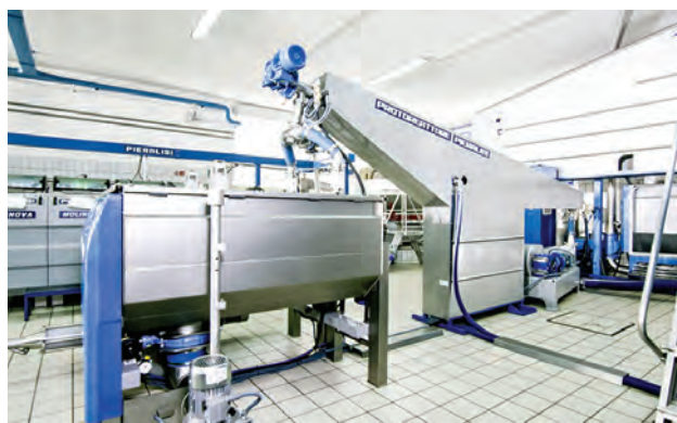
Immagini del Protoreattore ® oggetto di uno studio in Spagna da parte del centro tecnologico di ricerca Fundacion Tecnova

nuto, risparmi idrici, elettrici, perdite di olio.