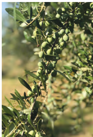
Un ramo della varietà Favolosa 17

te delle misure a regia nazionale come questa, sia sul trasferimento delle somme alla Regione destinate agli indennizzi". Sulla base delle istruzioni operative, le domande di aiuto presentate ad Agea sono state 168 domande di aiuto, di cui, come detto, 161 sono risultate ammissibili e finanziabili. Le somme liquidate equivalgono al 65% dell'importo totale che è superiore ai 4,1 milioni di euro. Da parte di Agea sono inoltre in corso di istruttoria le 68 schede di ricognizione preventiva presentate entro il 20 luglio 2020, con pubblicazione dell'elenco degli ulteriori frantoi che hanno titolo a richiedere l'aiuto. Per chi non ha ancora provveduto alla presentazione della domanda di aiuto, Agea ricorda che - con le istruzioni operative n. 70 del 28 luglio 2020 - sono stati prorogati i termini